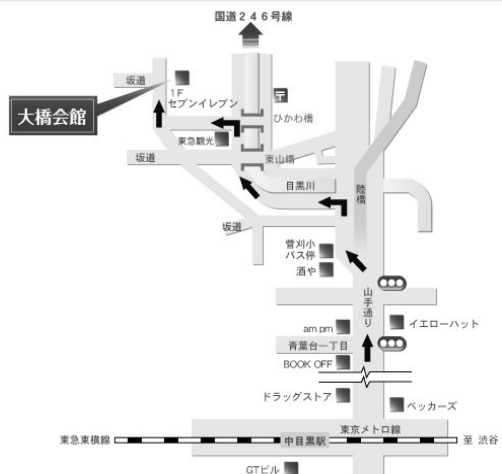
中目黒駅からお越しの場合

東急東横線『中目黒駅』下車、山手通りを1kmほど進んだ 信号6個目の先の陸橋側道を入ります。 目黒川沿いの一方通行を左折、 2つ目の橋(ひかわ橋)を左折します。 突き当たりを右折するとセブンイレブンが見え、 同建物が大橋会館です。